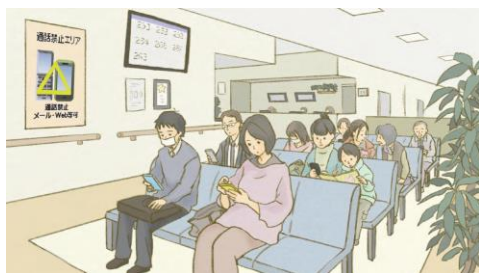
待合室での利用ルール設定