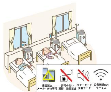
携帯電話・無線 LAN 機器の利用ルールの設定