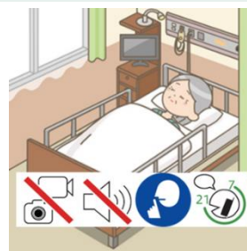
多人数病室の携帯電話利用ルールの設定