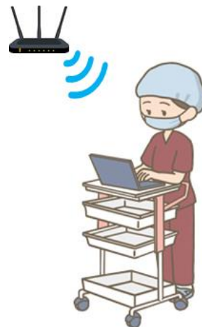
適切な無線 LAN AP の配置・出力の調整