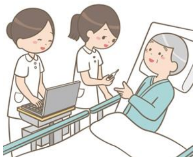
業務用無線 LAN の適切な設定・管理