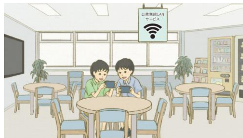
面会スペースでの患者・来訪者用無線 LAN 提供