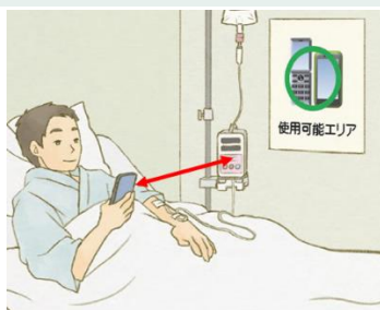
携帯電話と医用電気機器の離隔距離の設定